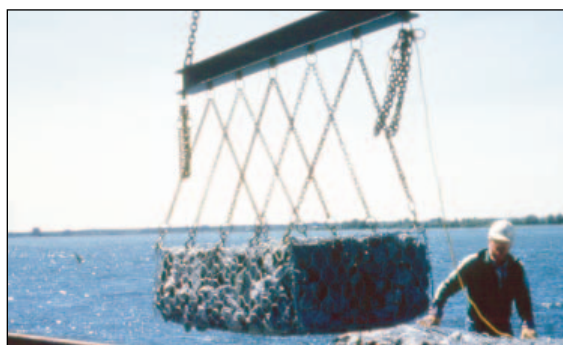
Gabion prêt pour la mise en place

De plus, il est possible qu'Honeywell débute le transport des matériaux en hiver, moment où l'impact du bruit et de la poussière est moins important pour les résidents. Cette mesure a également l'avantage de réduire le nombre de passages de camions en été.