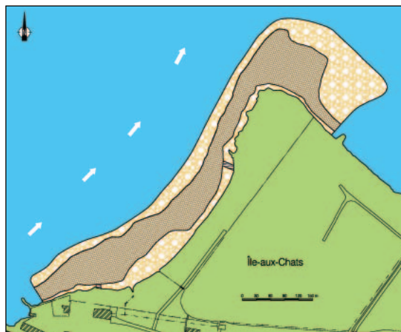
Zone A : Composition du recouvrement Perré Matelas de gabions

Conclusions – Les études réalisées par NIVA ont démontré que le recouvrement projeté est efficace pour empêcher toute diffusion de contaminants depuis les sédiments vers la colonne d'eau sus-jacente.